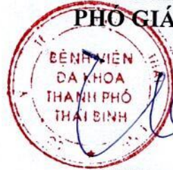
Bùi Thanh Sơn